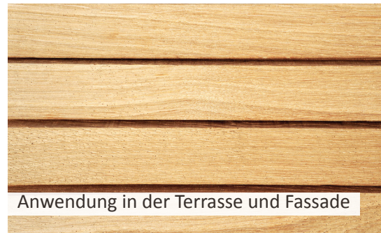
Anwendung in der Terrasse und Fassade